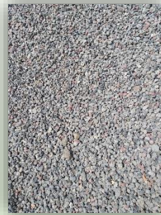
Splitte Ziegel und Beton