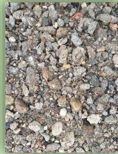
Oberboden und FSS Beton 0/45 B2, zertifiziert