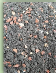
Wegedecken und Baumsubstrate