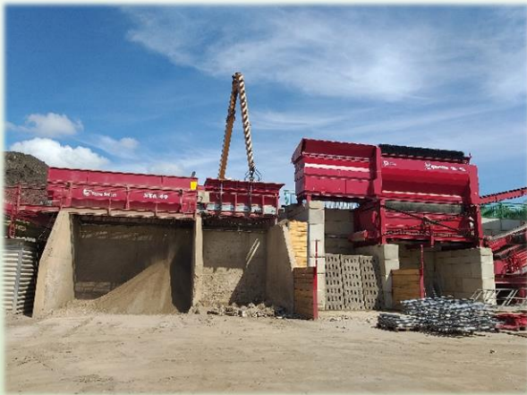
Unser Now-How mit neuen Technologien.