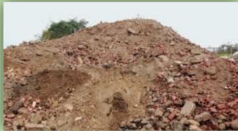
Neu entwickelte Technologien zur besseren Aufarbeitung.